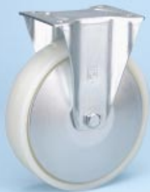
Serie KN B-FA