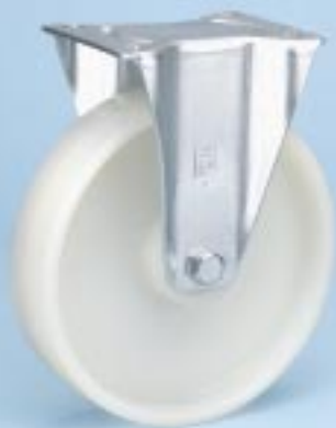
Serie KN B