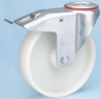
Serie KN R-FSTF