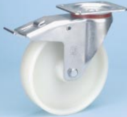
Serie KN L-FSTF