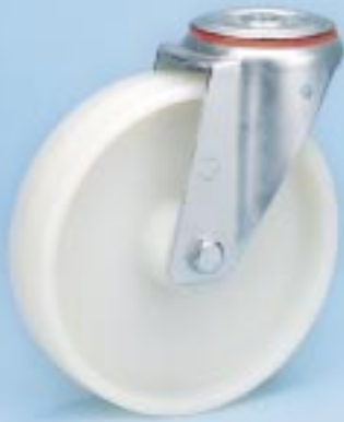
Serie KN R