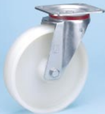
Serie KN L