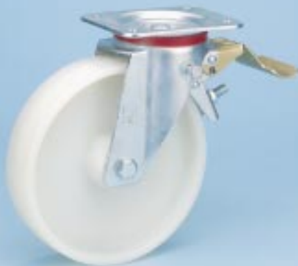
Serie KN L-FSTR